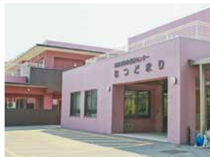
〒039-3364 青森県東津軽郡平内町大字小豆沢 字茂浦沢38 TEL 017-755-4001 FAX 017-755-4919