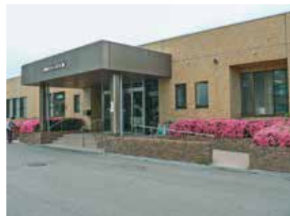
〒030-0947 青森県青森市大字浜館字間瀬85-1 TEL 017-741-4301 FAX 017-741-4344