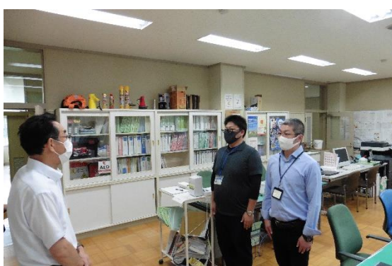
就労サポートセンターはくちょう