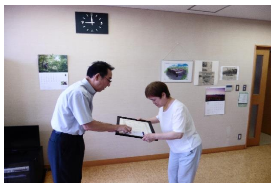
青森県長寿社会振興センター