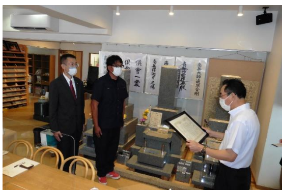
株式会社 番地銘石